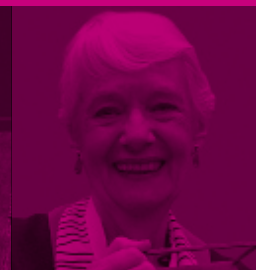
2010 Laura Devetach ARGENTINA