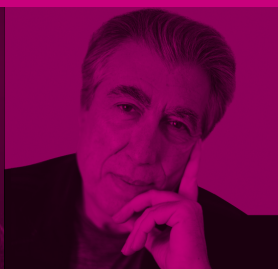
2013 Jordi Sierra i Fabra ESPAÑA