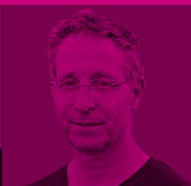
2014 Ivar Da Coll COLOMBIA